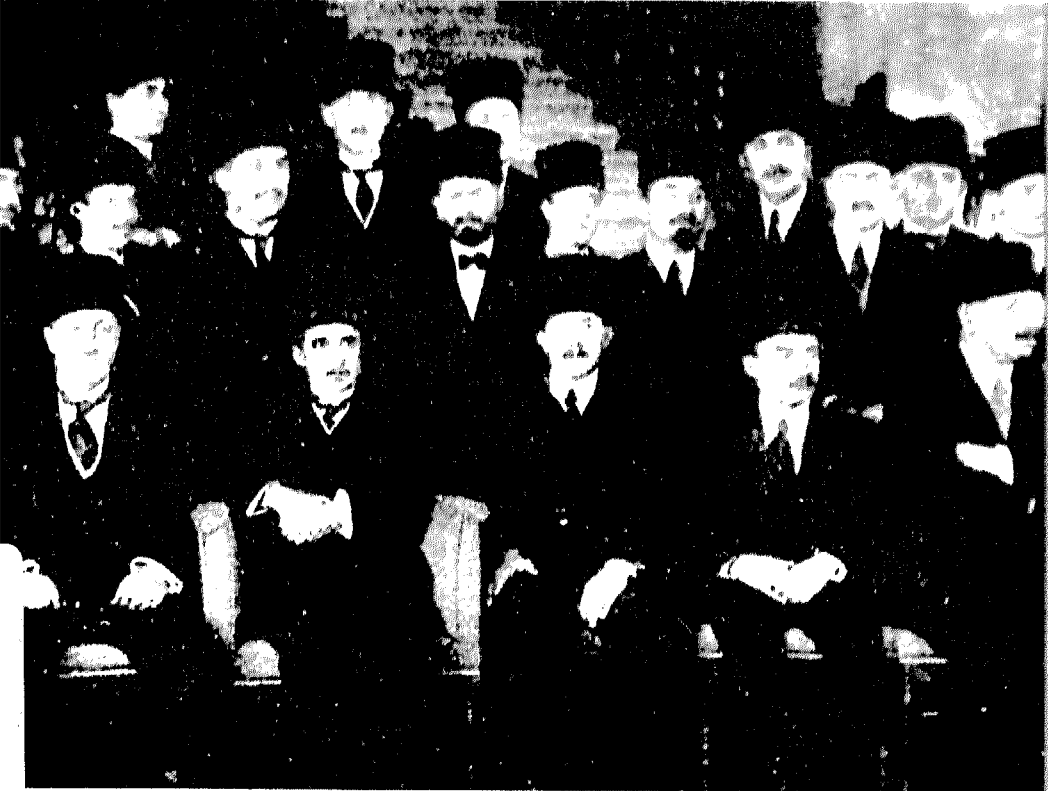
الوفد التركي في مؤتمر «لوزان» ١٩٢٣